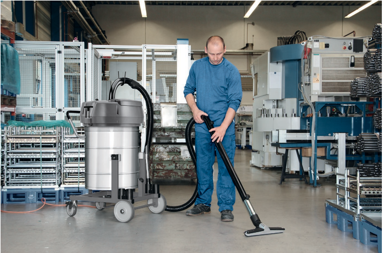
IVR-L 100/24-2 Tc Me